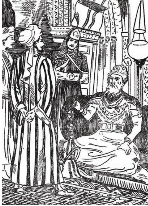
السُّلْطَانُ «مَحْمُودٌ» يَتَحَدَّثُ مَعَ أَوْلَادِهِ.

وَقَدْ نَشَأْتُمْ — مُنْذُ حَدَاثَتِكُمْ — عَلَى الْإِسْتِقْلَالِ فِي الرَّأْيِ؛ فَلَمْ أَفْرِضْ عَلَيْكُمْ طَاعَتِي فَرَضًا، وَلَمْ أَرْضَ لِنَفْسِي أَنْ أُمَيِّرَ وَاحِدًا مِنْكُمْ عَلَى أَحْوِيهِ. وَإِنْ كُنْتُ وَاثِقًا أَنْكُمْ أَطُوعُ إِلَى تَنْفِيذِ إِشَارَتِي — أَيًّا كَانَتْ — بِلَا اِعْتِرَاضٍ وَلَا مُنَاقَشَةٍ.