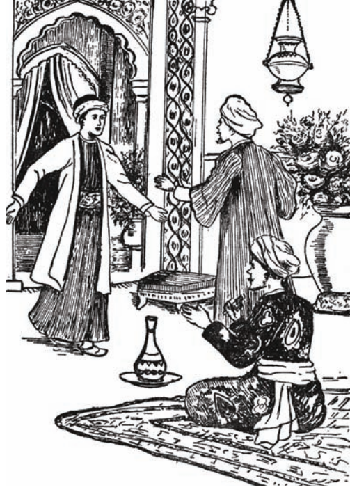
الإخوة الثلاثة يلتقون في الفندق بعد غياب عام.

فَإِنَّ مَا أَتَيْتُهُ فِي مَظْهَرِيكُمْ، وَقَسَمَاتِ وَجْهِكُمْ، وَمَا أَرَاهُ عَلَى أَسَارِيرِكُمْ مِنْ دَلَائِلِ الْإِبْتِهَاجِ وَالْبِشْرِ؛ دَلِيلٌ عَلَى مَا أَحْرَزْتُمَاهُ مِنْ فَوْزٍ وَنَصْرِ. وَلَا رَيْبَ فِي أَنَّ كُلًّا مِنْكُمَا أَرْدَادَ خِبْرَةٍ بِالدُّنْيَا؛ وَمَعْرِفَةَ الْحَيَاةِ، بَعْدَ أَنْ شَهِدَ مِنَ الْبِقَاعِ النَّائِيَةِ، وَالْأَمْكِنَةِ الْقَاصِيَةِ، مَا لَمْ تَكُنْ شَهِدْتَهُ عَيْنَاهُ، وَبَعْدَ أَنْ اسْتَبَانَ لَهُ مَا عِنْدَ الْأُمَمِ الْمُخْتَلِفَةِ مِنْ عَجَائِبَ وَغَرَائِبَ، وَمِنْ طَرَائِفَ وَلَطَائِفَ، وَمَا وَصَلَ إِلَيْهِ الْبَاجِثُونَ وَأَهْلُ الْعِلْمِ فِي مَيْدَانِ الزَّرَاعَةِ وَالصَّنَاعَةِ مِنْ أَسْرَارٍ وَحَقَائِقَ، مِمَّا يَجْدُرُ أَنْ يَنْتَفِعَ بِهِ الْإِنْسَانُ، أَيُّنَمَا كَانَ، وَلَا يَنْفَرِدُ بِهِ وَطَنٌ دُونَ سَائِرِ الْأَوْطَانِ.