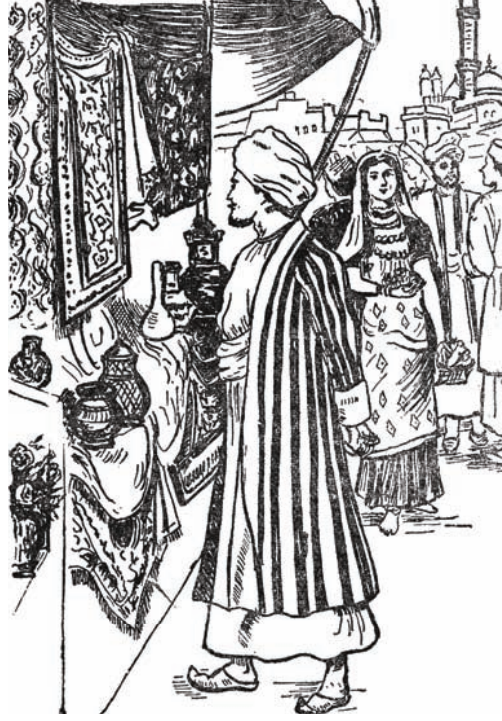
الأمير «حسين» في سوق الثياب.

وَكَانَ أَرِيحُ الْوَرْدُ الذِّكِّيُّ يَفُوحُ فِي كُلِّ مَكَانٍ، فَيُنْعِشُ النُّفُوسَ شَدَاهُ الْمُعَطَّرُ، وَلَا يَكَادُ يَخْلُو مِنْهُ بَيْتٌ وَلَا مَتَجَرٌ! وَقَدْ عَرَفَ الْأَمِيرُ أَنَّ أَهْلَ هَذِهِ الْمَدِينَةِ قَدْ بَرَعُوا فِي اسْتِخْرَاجِ الْعُطُورِ مِنَ الْأَزْهَارِ وَالرِّيَّاحِينَ، وَتَقْطِيرِ أَنْوَاعٍ مِنَ السَّوَائِلِ الطَّائِرَةِ ذَاتِ الرَّائِحَةِ الذِّكِّيَّةِ، وَهِيَ سَوَائِلُ سَرِيعَةُ التَّبَخُّرِ، لَا تَكَادُ تَرْتَفِعُ السَّدَادَةُ عَنْ قَنِينَتِهَا حَتَّى يَمَلَأَ الْجَوَّ عِطْرُ فَوَاحٍ. وَسَمِعَ الْأَمِيرُ فِي أَثْنَاءِ أَحَادِيثِهِ مَعَ الْأَهْلِيْنَ أَنَّهُ كَانَ هُنَاكَ مِنْ بَيْنِهِمْ رَجُلٌ قَضَى عُمُرَهُ كُلَّهُ فِي تَجَارِبِ مُتَوَاصِلَةٍ، أَرَادَ بِهَا أَنْ يَسْتَخْرِجَ مِنْ بُحَارِ النَّبَاتَاتِ وَالْأَعْشَابِ مَادَّةً أَثَرِيَّةً: