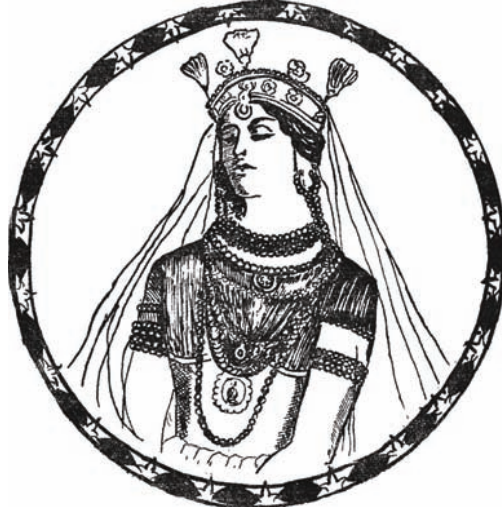
بنتُ العمِّ: «نورُ النهار».